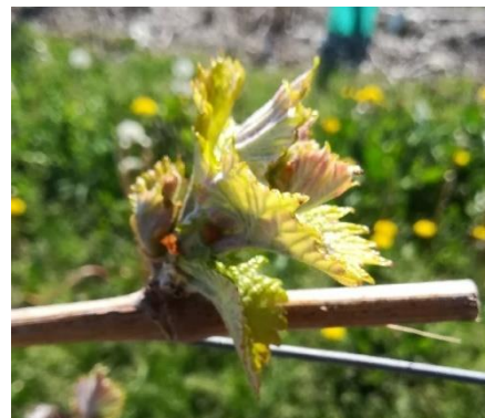
Stade 09 – 2/3 feuilles étalées