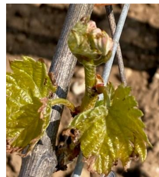
Brulures de vent salé, Île de Ré

Du 18/04 au 21/04, la prévision météorologique la plus probable annonce une absence de pluie. L'hypothèse la plus pessimiste annonce un cumul de pluie de 1,5 mm dans le vignoble. Des précipitations plus importantes vont probablement se produire le week-end prochain (maximum 20 mm). Les températures vont aller de 4°C à 6°C pour les minimales et 18°C à 21°C pour les maximales.