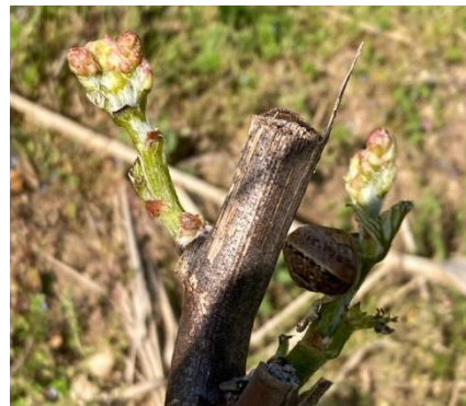
Escargot sur jeune pousse

Des dégâts d'escargots sont signalés dans certains secteurs du vignoble. Les escargots sont maintenant bien montés dans les pieds de vigne.