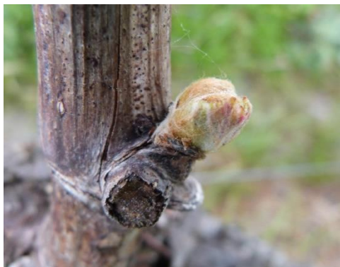
Stade 05 – Pointe verte

En moyenne, l'Ugni blanc est entre le stade 03 (bourgeon dans le coton – BBCH 05) et 05 (pointe verte – BBCH 09). De nombreux bourgeons sont au stade 07 (première feuille étalée – BBCH 11). Les bourgeons les plus avancés sont au stade 09 (2/3 feuilles étalées – BBCH 12/13).