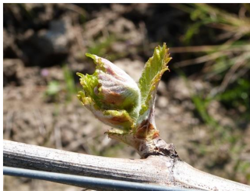
Stade 07 – Première feuille étalée